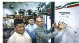
ARMIZAN merasmikan pelbagai gerai Majlis Perasmian Richiamo Mart pertama di Plaza Bangi Perdana, Bangi semalam.

BANGI — Kegiatan penjualan minyak masak peket bersubsidi secara dalam talian dengan tidak mengikut harga dan kuantiti yang ditetapkan adalah melanggar Akta Kawalan Belangan 1961 (Akta 122).